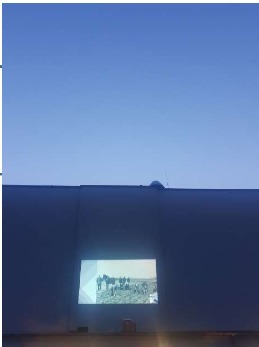
Akimirka iš renginio.

Pasitelkiant šviesos instaliacijas, ant Mokymo centro pastato sienų buvo pristatoma archyvinė medžiaga, pasakojanti apie Lietuvos valstybės bausmių vykdymo sistemos istorinius etapus.