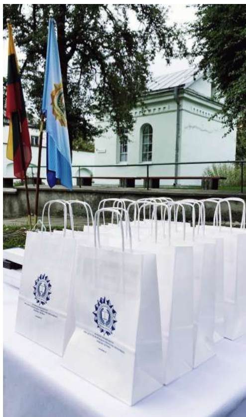
Akimirkos iš renginio.